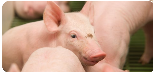
Certains dérivés de sous-produits animaux peuvent désormais être réintégrés dans l'alimentation des porcs et des volailles